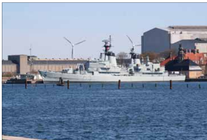
Fregatten PEDER SKRAM ved "Elefanten."

Kr. 500,- pr. år. Alle fordele som ved familiemedlemskab plus ret til at medtage yderligere 6 gæster pr. besøg.