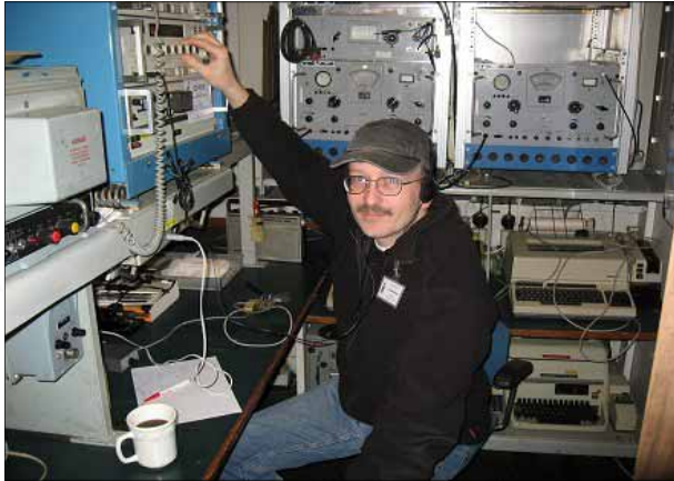
Fra skibets radiostation er der forbindelse til hele verden via amatørradio.

PEDER SKRAM blev køllagt på Helsingør Skibsværft i 1964 og søsat i 1965. Fregatten vakte international opsigt. Det var første gang, en marine installerede kombinationen af dieselmotorer og gasturbiner samt vendbare skrueblade i så stort et skib. Det var også den første missilbærende enhed i Søværnet. Fregatten er et stykke unikt dansk skib-bygnings-historie og er derfor bevaringsværdig. Støtteforeningen "Fregatten PEDER SKRAM's Venner" blev oprettet den 2. juli 1996 med det formål at støtte arbejdet med at genudruste fregatten og oprette et korps af kustoder, som kan bemane fregatten, når den periodevis åbnes for publikum. Det skete første gang i sommeren 1996. Siden 1996 har Venneforeningen årligt kunnet overføre en væsentlig del af medlemmernes kontingent til Fonden. Fregatten har i sommermånederne været åben for publikum. Entré-indtægterne dækker en væsentlig del af de daglige driftsomkostninger.